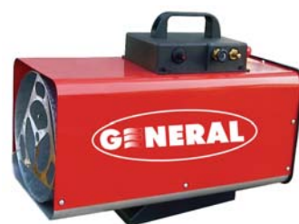
Grisou 25 R