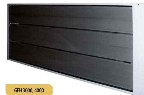
GFH 3000, 4000