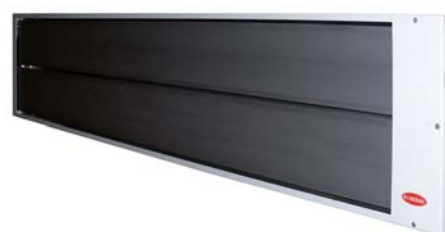
GFH 2000, 2600