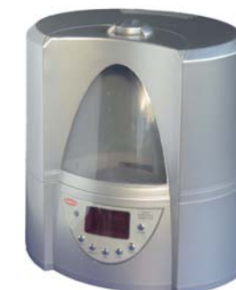
Ультразвуковые увлажнители воздуха

Представлено 2 вида тепловентиляторов: спиральные и керамические. Керамические тепловентиляторы благодаря низкой температуре нагревательного элемента (керамические пластины) «не сжигают» кислород, очень надежны и долговечны.