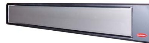
GFH 1100, 1400