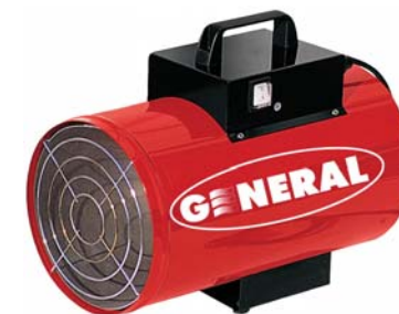
Тепловые пушки на сжиженном газе

Тепловые пушки обеспечивают экономичный, практичный и быстрый обогрев помещений, таких как: склады, мастерские, цеха, конференцзалы и строительные площадки. Также они применяются для целей осушения. Легко устанавливаются и могут использоваться, как для полного обогрева помещения, так и для создания дополнительного тепла.