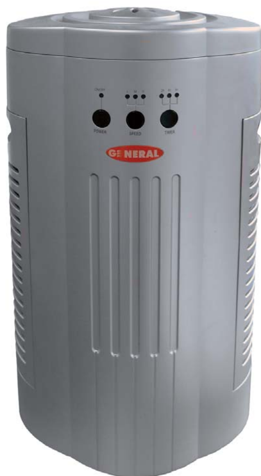
Очиститель воздуха 602-04 с фильтром № 602-04