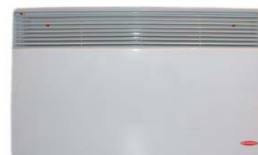
primero 2000 MW