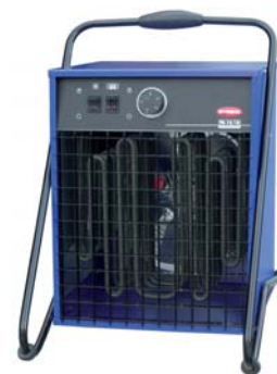
Электрические тепловые пушки

Из-за того, что плотность теплого воздуха меньше, чем холодного, он поднимается вверх. Конвекция обеспечивает наиболее равномерный обогрев помещения, хорошее перемешивание воздуха в комнате, и при этом не создается сквозняков. Конвекторы General имеют привлекательный дизайн, красивую эмалевую поверхность и прекрасно вписываются в интерьер помещений.