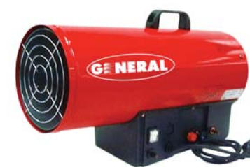
K2C-G 250 A